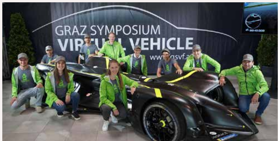
© Wolfgang Wachmann / Virtual Vehicle